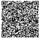
申込用 QR コード